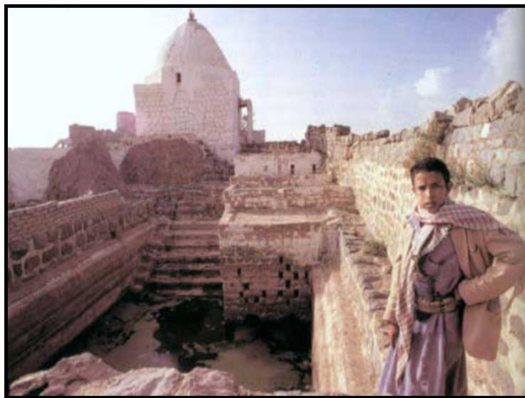
Figura N° 1. Cisterna a cielo abierto para la recolección de agua lluvia. Yemen.

En Centroamérica se conoce el caso del Imperio Maya donde sus reyes sostenían a sus pueblos de modos prácticos, ocupándose de la construcción de obras públicas. Al sur de la ciudad Oxkutzcab (estado de Yucatán) en el pie de la montaña Puuc, en el siglo X a.C. el abastecimiento de agua para la población y el riego de los cultivos se hacía a través una tecnología para el aprovechamiento de agua lluvia, el agua era recogida en un área de 100 a 200 m 2 y almacenada en cisternas llamadas “Chultuns”, estas cisternas tenían un diámetro aproximado de 5 m, y eran excavadas en el subsuelo e impermeabilizadas con yeso. En Cerros, una ciudad y centro ceremonial que se encuentra en el actual Belice, los habitantes cavaron canales y diques de drenaje para administrar el agua de lluvia y mediante un sistema de depósitos, estos permitían que la gente permaneciera en la zona durante la estación seca cuando escaseaba el agua potable (año 200 d.C.). En otras zonas de las tierras bajas, como en Edzná, en Campeche, los pobladores precolombinos de esta ciudad construyeron un canal de casi 50 m de ancho y de 1 m de profundidad para aprovechar el agua de lluvia, este canal proporcionaba agua para beber y regar los cultivos.